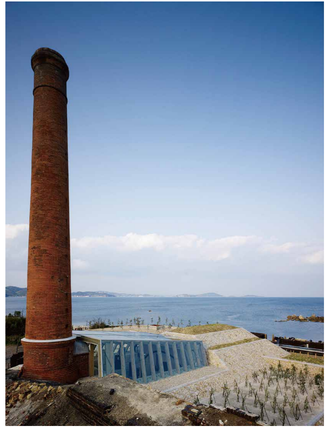
犬島精錬所美術館

犬島は、瀬戸内海に浮かぶ周囲約4キロの岡山市唯一の有人島。良質な石を産出し、古くは岡山城、大阪城の石垣などに使われました。1909年、犬島製錬所が開設された後は、最盛期に5,000人から6,000人あまりの人が生活していましたが、銅の価格が大暴落し、わずか10年で操業を終えました。現在の人口は約50人となっていますが、近代化産業遺産である製錬所跡を美術館として再生・保存し、現在ではアートの島として脚光を浴びています。