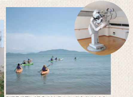
指導員が優しく教えてくれるので、初心者でも安心。(4/15~10/15 体験可)