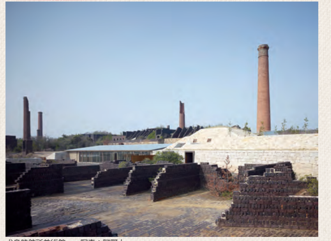
犬島精錬所美術館

犬島「家プロジェクト」A邸 ヘアトリス・ミラーゼス「Yellow Flower Dream」2018 TEL: 086-947-1112 開館時間: 9:00 ~ 16:30 (最終入館は16:00まで) 休館日: 火曜日から木曜日(3月1日~11月30日)、全日(12月1日~2月末日)、祝日の場合は開館、翌日休館。 ただし月曜日が祝日の場合は、火曜日開館、翌水曜日休館。 鑑賞料: 2,100円(犬島精錬所美術館、犬島「家プロジェクト」共通/15歳以下無料) 瀬戸内国際芸術祭2022期間中(4-11月)についての詳細はウェブサイトをご覧ください。http://benesse-artsite.jp/calendar