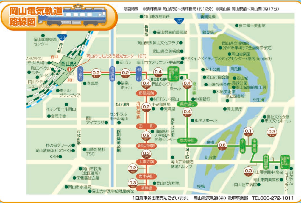
1日乗車券の販売もございます。岡山電気軌道(株) 電車事業部 TEL086-272-1811

岡山駅構内 (岡山駅2階新幹線乗降口東側) お問い合わせ先 ☎086-222-2912