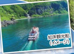
知床観光船 (イメージ)