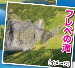
フレペの滝 (イメージ)