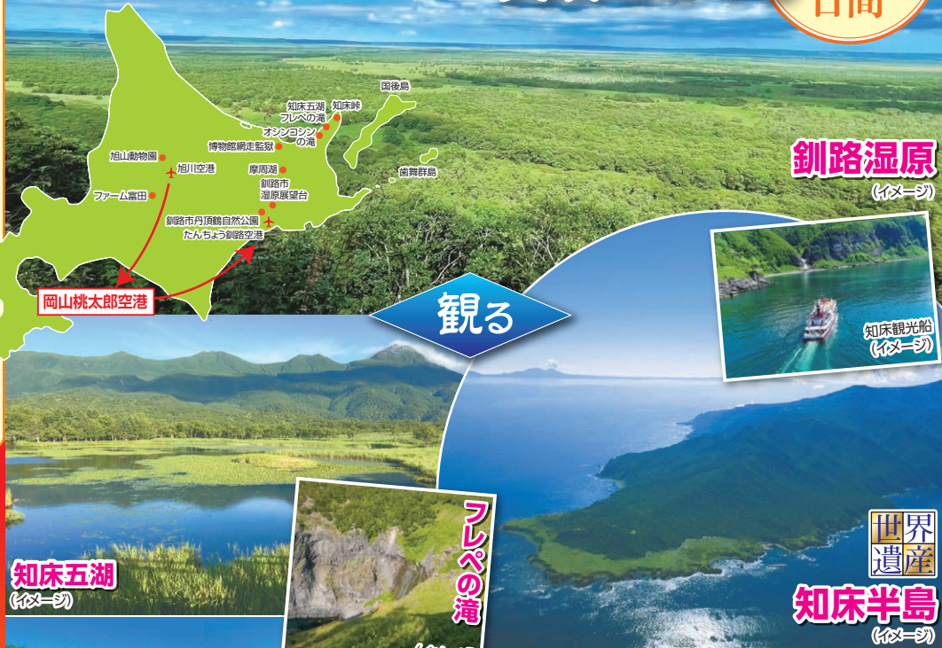
釧路湿原 (イメージ)