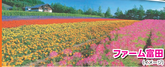
ファーム富田 (イメージ)