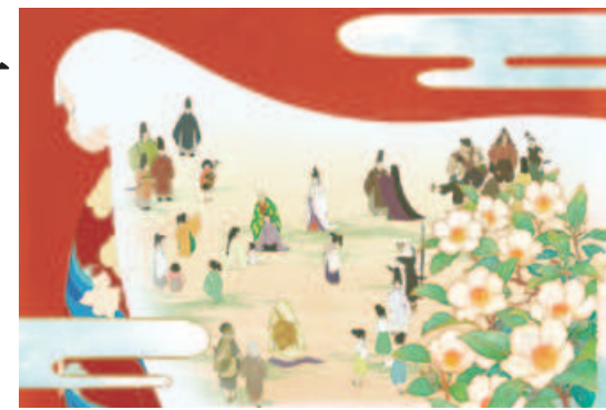
TVアニメ「平家物語」メインビジュアル