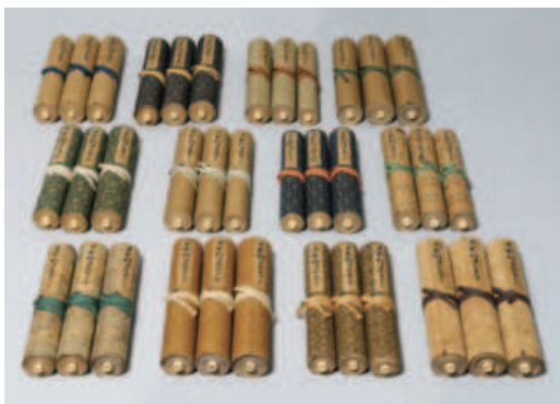
平家物語絵巻 全36巻 土佐左助 江戸時代

本展は当館が所蔵する、現存唯一の全巻揃った『平家物語絵巻』をPART I・IIと二期に分け、皆様ご存じの名場面を展覧いたします。さらに令和4年(2022)に放映され、高い評価を得たTVアニメ「平家物語」とのコラボレーション展示を行うことで、様々な角度から物語を楽しんでいただけます。