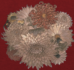
菊花・虫図 正阿弥勝義作 明治時代