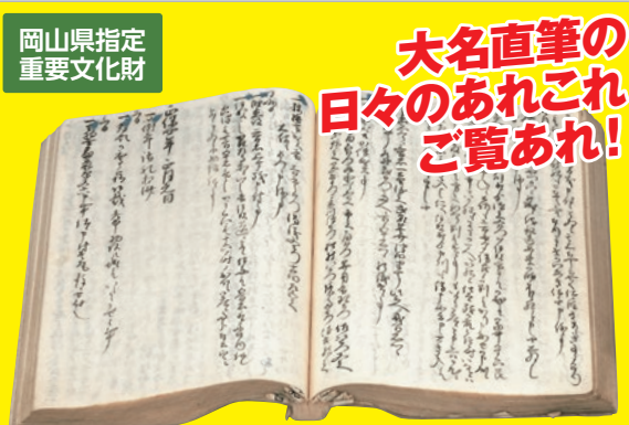
岡山県指定 重要文化財