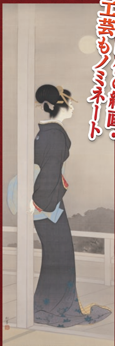
明治時代の絵画、工芸モノ、ミニアート

いただけるかもしれません。本展では、投票上位の作品を展示するとともに、投票用紙に記入いただいた美術館でのエピソードをご紹介します。皆さまと一緒に「林原美術館の60年」を振り返ります。