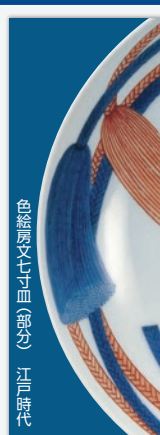
色絵陶文七寸皿(部分) 江戸時代