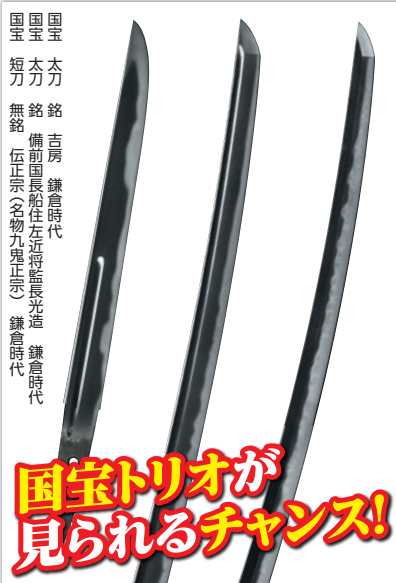
国宝 太刀 銘 吉房 鎌倉時代 国宝 短刀 銘 備前国長船住左近将監長光造 鎌倉時代 国宝 無銘 伍正宗(名物九鬼正忠) 鎌倉時代