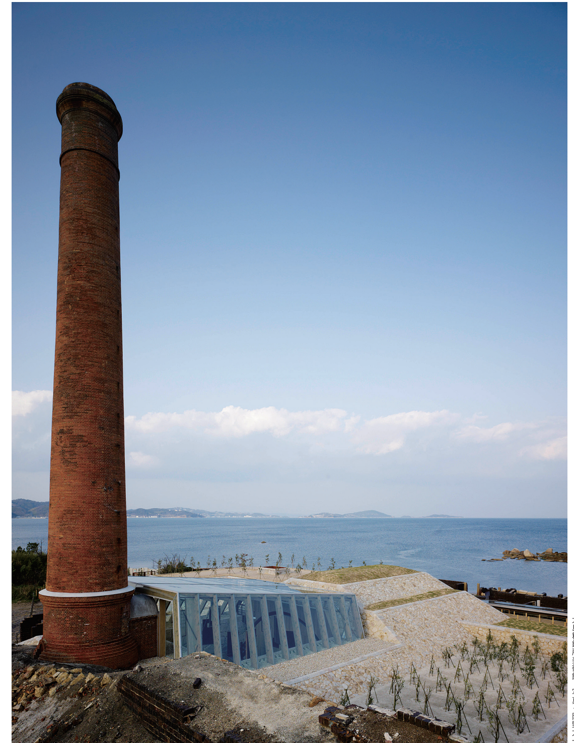
犬島精錬所美術館

犬島は、瀬戸内海に浮かぶ周囲約4キロの岡山市唯一の有人島。良質な石を産出し、古くは岡山城、大阪城の石垣などに使われました。1909年、犬島製錬所が開設された後は、最盛期に5,000人から6,000人あまりの人が生活していましたが、銅の価格が大暴落し、わずか10年で操業を終えました。現在の人口は約40人となっていますが、近代化産業遺産である製錬所跡を美術館として再生・保存し、現在ではアートの島として脚光を浴びています。