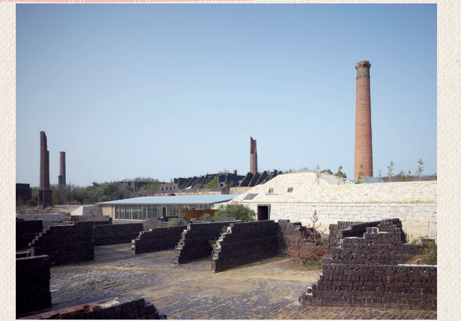
犬島精錬所美術館

TEL: 086-947-1112 開館時間: 9:00 ~ 16:30 (最終入館は 16:00 まで) 休館日: 火曜日から木曜日 (3月1日~11月30日)、祝日の場合は開館、翌日休館。 ただし月曜日が祝日の場合は、火曜日開館、翌水曜日休館、全日 (12月1日~2月末日)。 鑑賞料: オンライン 2,100円/窓口 2,300円 (犬島精錬所美術館、犬島「家プロジェクト」共通) 詳細はウェブサイトをご覧ください。http://benesse-artsite.jp/