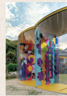
犬島「家プロジェクト」A邸 ペアトリス・ミリャーゼス「イエロー フラワー ドリーム」2018

犬島精錬所美術館は、近代化産業遺産である銅製錬所の遺構と自然エネルギーを活用した環境に負荷を与えない建築と、三島由紀夫をモチーフとした作品で構成されています。犬島「家プロジェクト」は、A邸、C邸など5つのギャラリーのほか野外にも作品が展示され、集落を巡りながら楽しめます。犬島くらしの植物園では、自然のサイクルに身を置き、食べ物からエネルギーに至るまで、自給自足しながら自然とともにくらす喜びを体験できる場づくりをしています。