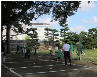
【クリーンキャンペーン】