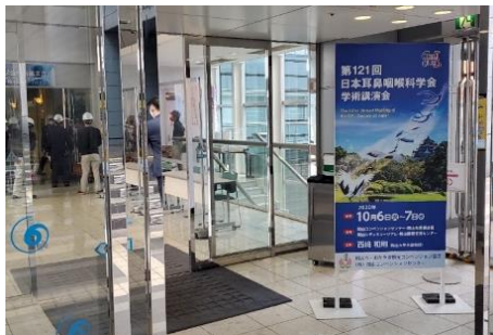
【岡山コンベンションセンター（立看板）】

当協会の定める要件を満たしたコンベンションの大会会場等へ歓迎看板や歓迎サインの設置を行った。 掲出件数：13件