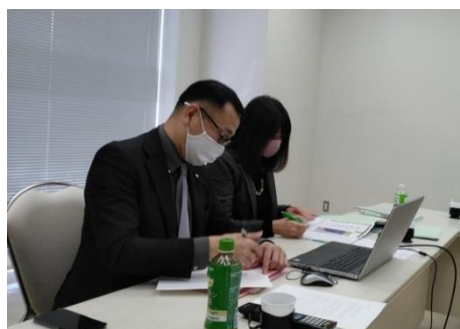
【オンライン会場の様子】