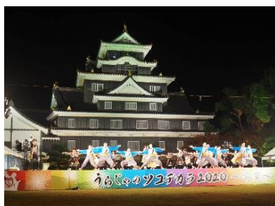
【天守閣等の夜間利活用の写真】

天守閣及び付属施設（不明門）、天守閣前広場の貸出を行い、天守閣1件、不明門2件、天守閣前広場1件の利用があった。