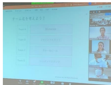
【第1回オンラインの様子】