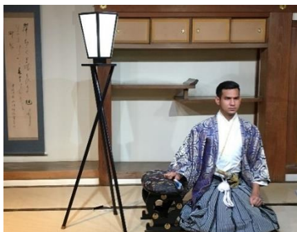
【岡山城にて着付け体験】