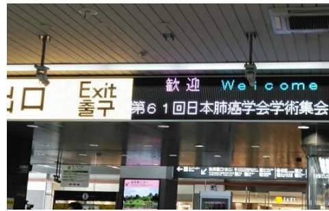
【JR岡山駅新幹線改札口（歓迎サイン）】