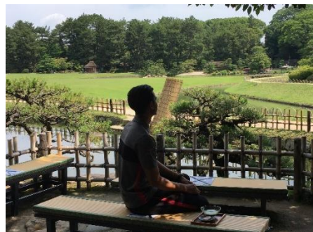
【岡山後楽園にて抹茶体験】