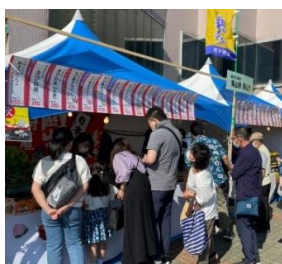
【出展ブースの様子】