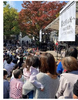
【イベントの様子（石山公園）】