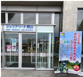
【ジップアリーナ前（立看板）】