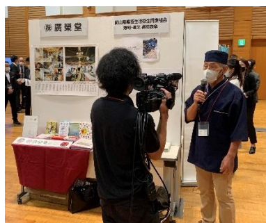
【会員出展ブースの様子】