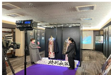
【不明門での展示の様子】