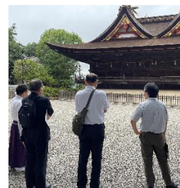
【吉備津神社視察の様子】