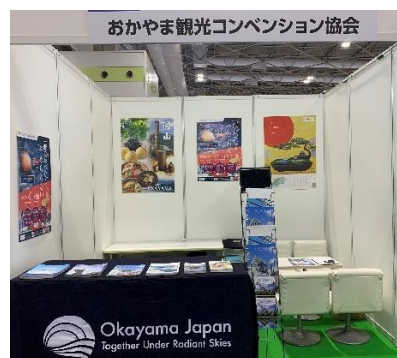
【MICE EXPO 出展ブースの様子】