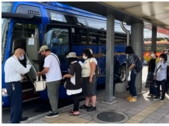
【吉備ロマン無料循環バス乗り場】