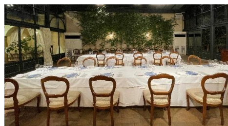
【東京セミナー交流会会場】