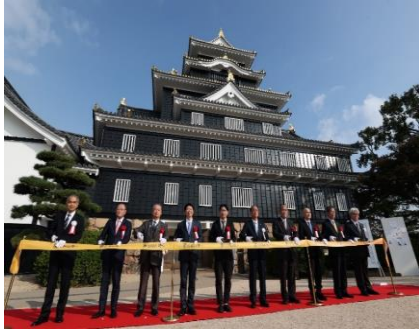
【オープニングセレモニー】