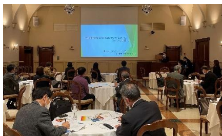
【東京セミナーの様子】