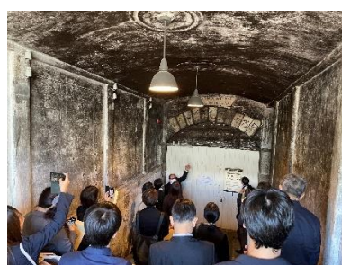
【岩の原葡萄園視察の様子】