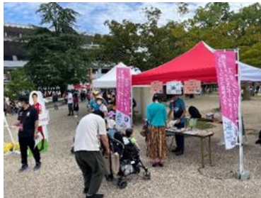
【スタンプラリーのブース】