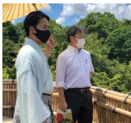
【岡山後楽園視察の様子】