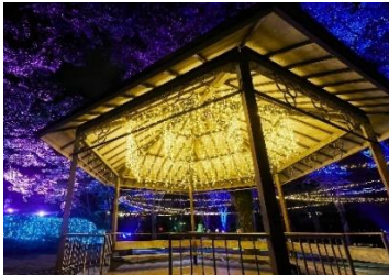
【旭川★星降る川辺の物語】