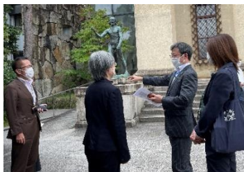
【大原美術館視察の様子】