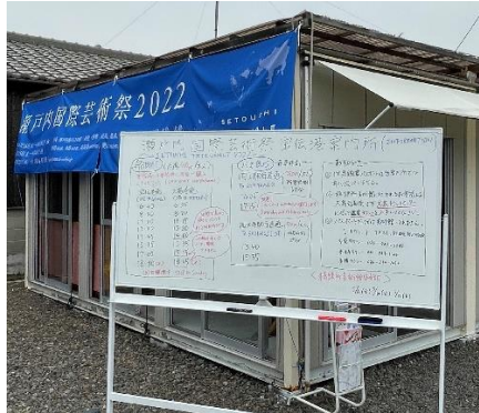
【宝伝港案内所の様子】