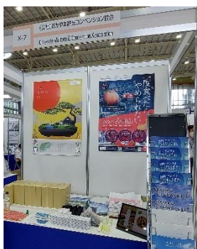
【日本応用物理学会秋季学術講演会出展ブース】