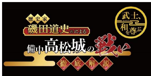
【歴史家 磯田道史氏による備中高松城の戦い】