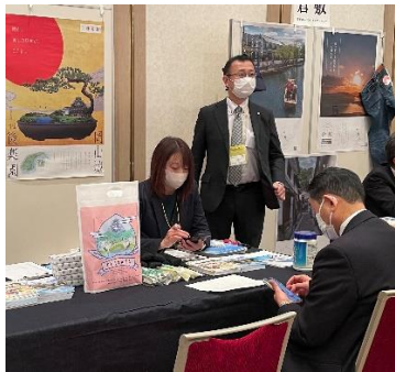
【中四国誘致懇談会 商談の様子】