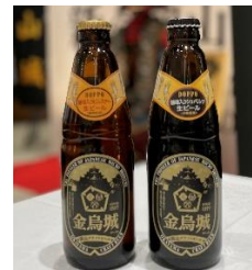
【金鳥城ラベル地ビール】