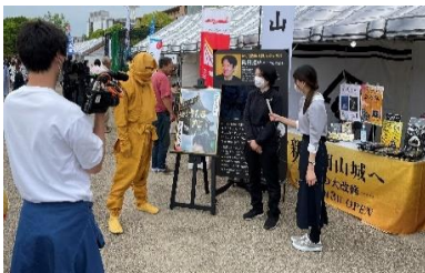
【姫路お城まつりに出展】

令和3年10月に運行開始した岡山城ラッピング路面電車を令和4年度も引き続き走らせることで、岡山城リニューアルをPRした。