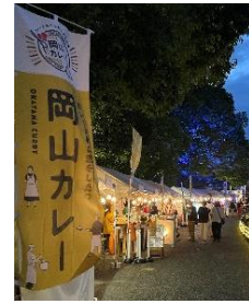
【岡山カレーフェスティバル 2022】