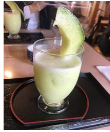
【陣屋町スタンプラリー景品】