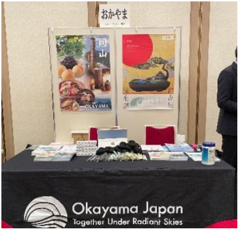
【中四国誘致懇談会 商談ブース】