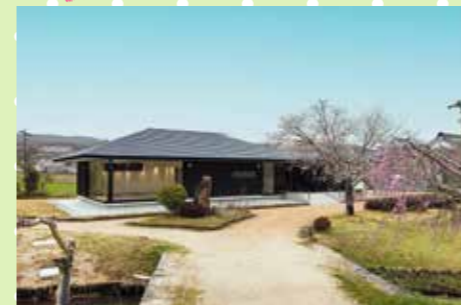
▲備中高松城址資料館

更に!!バスの運行に合わせて、周遊イベントやマルシェ等を開催! 詳しくはQRコードから特設サイトをチェック▶