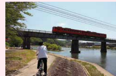
▲ たけべレンタサイクル