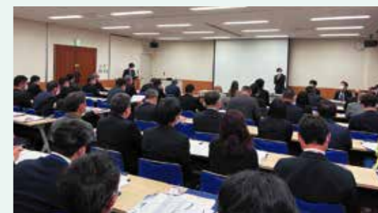
▲ 第1回コンベンション部会の様子

4月28日(金)に令和5年度 第1回コンベンション部会を岡山コンベンションセンターにて開催いたしました。当日は、部会登録会員計91団体のうち52団体62名様にご参加いただきました。部会では、令和4年度及び令和5年度コンベンション開催件数等の状況報告、令和5年度コンベンション事業計画、令和5年度コンベンション部会の活動についての3つの議題により進行し、情報提供として岡山城リニューアルオープン後についての進捗報告も行いました。また、協議・報告の終了後に情報交換会を設け、部会参加者間の交流を深めていただくとともに、協会会員の連携強化につなげました。