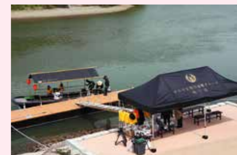
▲ 遊覧クルーズ乗降場