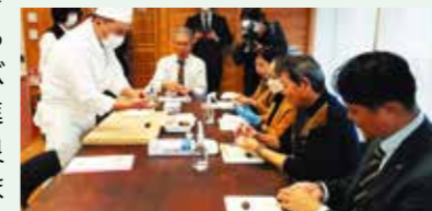
▲ 廣栄堂の和菓子作り体験の様子