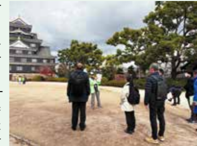
▲ おかやまもたろうガイドによる岡山城の案内

昨年の11月と12月には観光庁事業を活用して瀬戸内海・倉敷アートコースと岡山歴史文化コースの2つのモニターツアーを企画し、ワーキンググループのメンバーで参加しました。実体験を通しての気づきや観光庁事業専門員によるセミナーやアドバイスは活動を進めていく上での良い機会になりました。