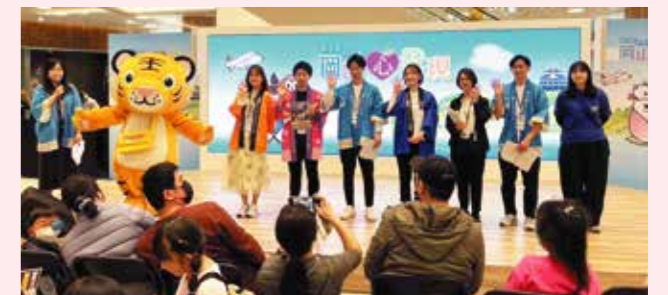
▲ 岡山フェアPRステージの様子