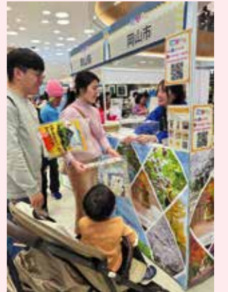
▲ 岡山市ブースの様子

3月4日(月)は台北旅行会社5社へ、観光情報の提供と商品造成の個別セールスを行いました。また3月11日(月)に韓国での観光商談会にも参加しました。今後もインフルエンサー招請とSNS発信、現地観光フェア出展、旅行会社セールスを通じ、インバウンド誘致活動を行ってまいります。