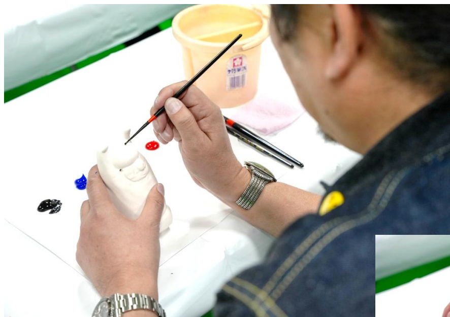
素焼きの招き猫に