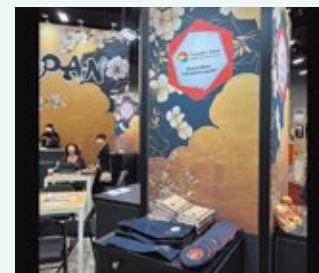
▲岡山ブースの様子

当協会は日本ブースにおいて、岡山へのコンベンションやインセンティブ旅行の誘致に向けた商談やプロモーションなど多くのMICE誘致のきっかけを創出することができました。今後も、岡山でより多くのコンベンションやインセンティブ旅行を開催していただけるよう、継続してセールス活動に取り組んでまいります。