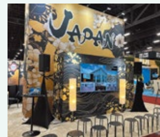
▲日本ブースの様子