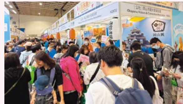
▲2025台北国際旅行博ブースの様子

【タイ】10月に今後伸びしろが期待できるタイで、旅行会社向けの岡山県セミナーや商談会が行われ、73社92名の旅行会社が参加しました。20社を超える旅行会社と商談を行い、岡山市の魅力を伝え、ツアー行程内に岡山を入れていただける様、観光素材を紹介しました。