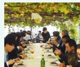
▲VIGNETTEの料理提供(昼の部)

引き続き関連業者の皆様と連携し、岡山ならではの魅力的なコンテンツ開発と利用促進を図ってまいります。