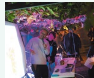
▲育種紹介の様子(夜の部)