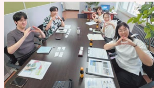
▲韓国現地旅行会社訪問の様子