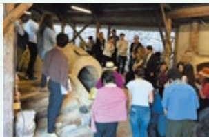
▲オプションツアーの様子